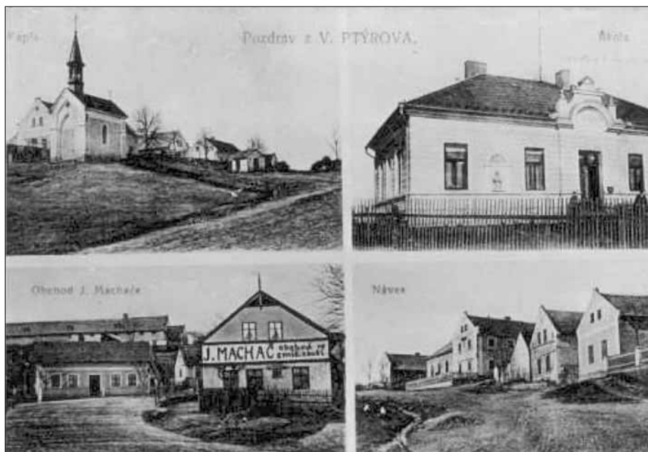
Stará pohlednice z Ptýrova

na 10 menších správních obvodů-rychet. Ptýrovská rychta zahrnovala osady Ptýrov, Ptýrovec, Maníkovice, Čihátka, Klokočku, Veselou, Haškov, Lhotice a Buda. V čele každé rychty stál vrchní rychtář, mimo něho měla každá osada i svého osadního rychtáře. Ten kromě jiného dohlížel na plnění robotních povinností a soudil také menší provinění poddaných, např. urážku na cti, spory o dluhy, škody na polích apod. Závažnější provinění trestal vrchnostenský soud. Z období 18. století se zachovaly záznamy o udělených trestech, včetně hrdelních. Například v roce 1740 byl odsouzen k trestu smrti a oběšen za krádež koní Pavel Havlíček z Ptýrovce.