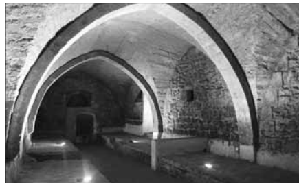
Velký sál johanitské komendy