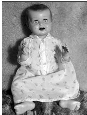
Mrkací panna, typický výrobek družstva DUBENA, foto: D. Rubáš, 2014