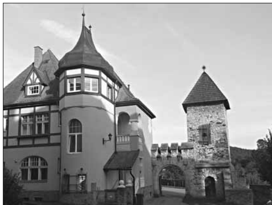
Městská hláska a „Helenhof“, foto: D. Rubáš, 2014

K zámku patří krajinný anglický park o rozloze 4,5 ha založený koncem 19. stol. Projekt vytvořil přední německý zahradní architekt E. Petzold.