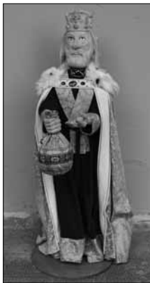
Vyřezávaná postava Karla IV. z českodubského betlému, foto: J. Šrýtr, 2014

padu a prosince r. 1357. V listinách, které zde císař sepsal, jsou uvedeny názvy „Eiche“ (Dub) a „zu den Duben der Creutzigen (na Dubu křížovníků).