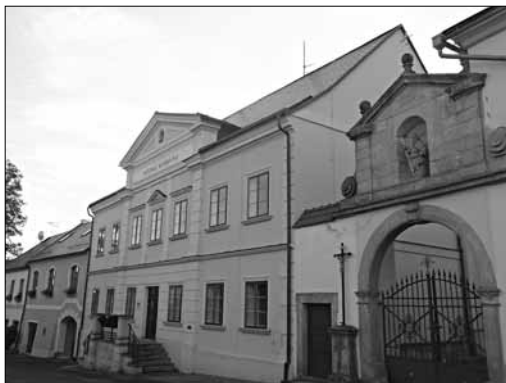
Malodubská obecná škola (dnes Městská knihovna), foto: D. Rubáš, 2014

(dnes domov důchodců): objekty tzv. „Michalovského dvora“ ze 16. stol. nechal v letech 1873–1874 přestavět na neoklasicistní zámek továrník Franz Schmitt. Krásná zimní zahrada s kopulí zanikla po druhé světové válce, dochovala se však velká část původního interiéru, štuková a řezbářská výzdoba nebo dubové obklady. Po první světové válce našla v nově přistavěném křídle své prostory škola, po druhé světové