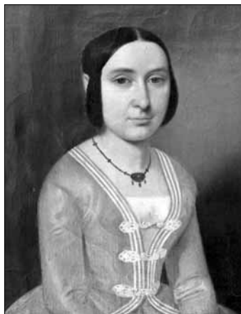
Karolina Světlá