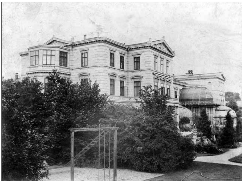
Schmittův zámek počátkem 20. století