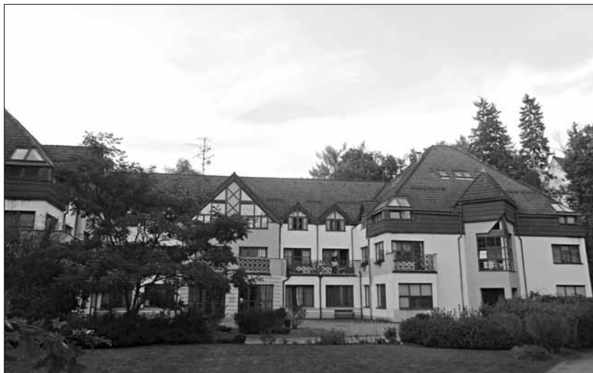
Dům s pečovatelskou službou, foto D. Rubáš, 2014

borů včetně loutkového divadla aj. Možnosti sportovního vyžití ve městě nabízí sportovní hala a sportovní areál s fotbalovým a multifunkčním hřištěm. Mezi významné sportovní akce patří kupř. Pochod krajem Ka-