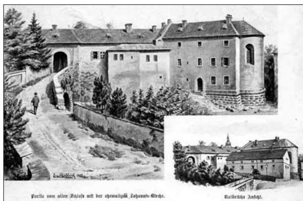
Vyobrazení kaple sv. Jana Nepomuckého od E. Ulbricha z roku 1897.

Kaple sv. Jana Nepomuckého (od vysvěcení v r. 1722, původně kaple sv. Jana Křtitele): ve 2. pol. 16. stol. ji nechal postavit Jan z Oprštorfu, a to výhradně pro katolické obřady. Po r. 1782 byla Josefem II. zrušena a na poč. 19. stol. přestavěna na městský špitál, část sloužila pro účely pivovaru.