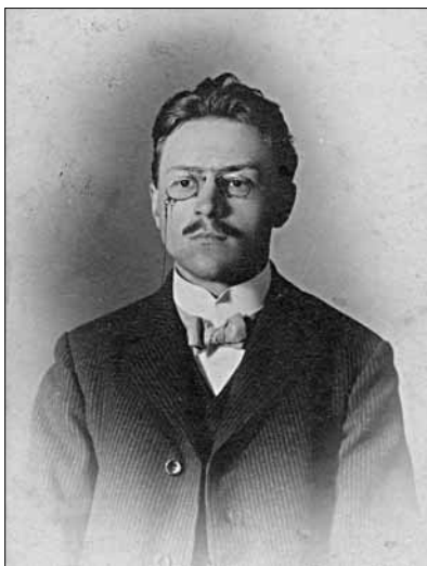
Řídící učitel Václav Havel