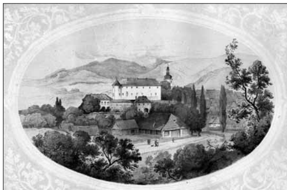
Grafický list českodubského zámku před požárem roku 1858 od V. Raua.

Řemeslná textilní výroba měla v Podještědí dlouhou tradici a poskytovala obživu velké části zdejších obyvatel. Např. v r. 1785 pracovalo v Českém Dubě 17 běličů plátna, 6 rytců tiskařských forem, 6 barvířů, 25 soukenických mistrů a 43