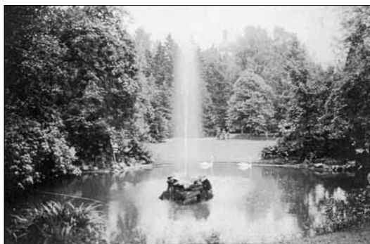
Městský park počátkem 20. století

S mecenášsky založenou rodinou Schmittových se pojí celkový rozkvět města silně poškozeného ničivým požárem roku 1858. R. 1867 byl do města zaveden telegraf, r. 1872 zřízen poštovní úřad. V 70. letech 19. stol. získal Český Dub plynové osvětlení, které bylo v r. 1885 nahrazeno elektrickým. Od r. 1888 má město veřejný vodovod (z pramenů na