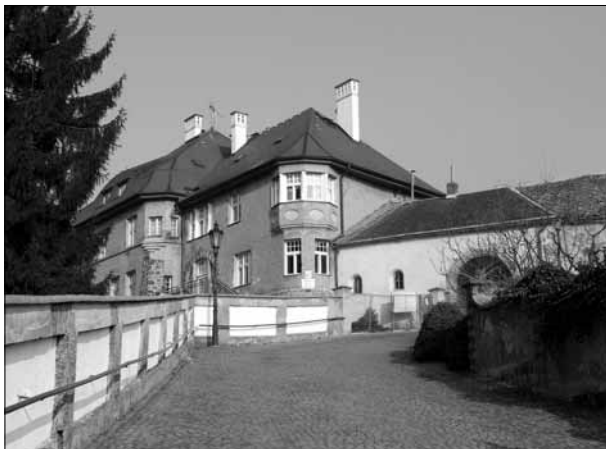
Mateřská škola s jižní zámeckou branou, foto: H. Gollová, 2014

Ve městě se nachází mateřská škola, základní škola se sportovní halou, základní umělecká škola, dům s pečovatelskou službou, domov pro seniory, knihovna, ordinace obvodních lékařů a zubního a veterinárního lékaře, pošta, pobočky několika bank, nákupní středisko a množství menších obchodů, restaurace, koupaliště, dětské hřiště aj. Ve městě působí Podještědské muzeum s odloučenou expozicí johanitské komendy a je zde pořádána řada kulturních akcí – hudební festivaly, koncerty, besedy, představení českých amatérských divadelních sou-