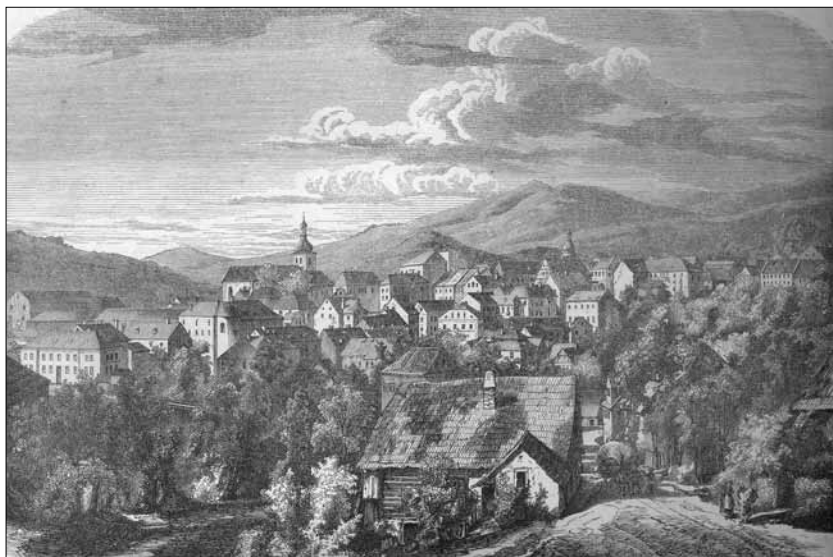
Veduta Českého Dubu z Prouskovy ulice od A. Levého z roku 1869

Český Dub, zasazený do krásné přírody, je městem s bohatou historií, množstvím památek, významnými archeologickými objevy, se širokým občanským zázemím pro obyvatele i návštěvníky.