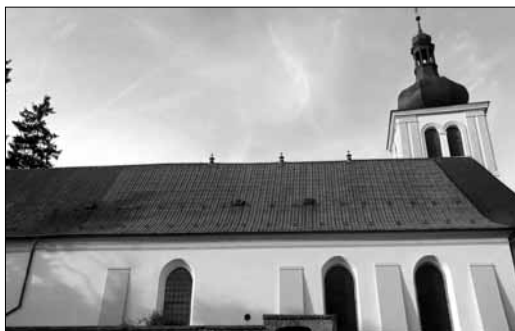
Kostel sv. Ducha (Sesláň Ducha svatého)