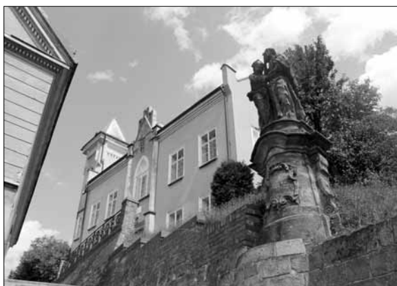
Husův sbor a sousoší „Loučení Krista s Pannou Marií“