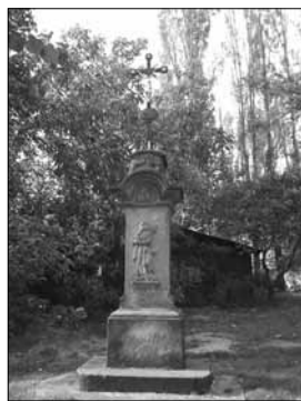
Kříž nedaleko kostela sv. Linharta. Foto: autor, 2015