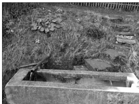
Pramen v Hlavici.