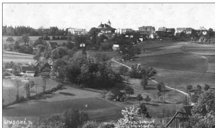
Pohled přes Starou Ves a město Vysoké nad Jizerou na Kokrháč v Krkonoších.