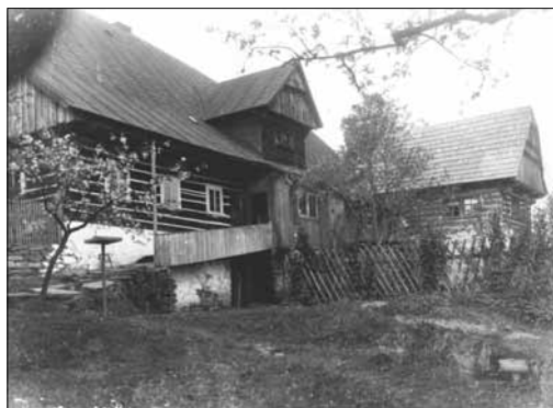
Sklenařice čp. 27 u „Tomášů“. začátek 20. století

něna jen takzvaná návší, tříčské a staroveské, kde jsou dosud uchována roubená stavení z doby před požárem. Jedenapadesát domů nebylo znovu postaveno. Kostel sv. Kateřiny, který velmi utrpěl požárem, byl postupně obnoven. 1836 došlo k „založení divadelní společnosti herců ve městě Vysokým po shoření třetího roku znova a s těžkostí zřízené“. Již někdy před rokem 1836 preceptor Bachtík vycvičil ze svých žáků kapelu, které byl pořízen i stejnokroj a která úspěšně koncertovala před knížetem Rohanem na Sychrově. Roku 1860 byl založen mužský zpěvácký spolek Krakonoš a o rok později dívčí pěvecká jednota Vlastimila. Ve Sklenařicích v čp. 27 u „Tomášů“ je po generace