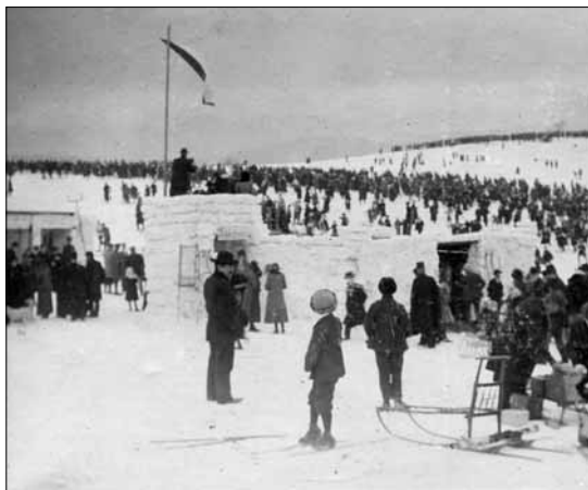
Lyžařské závody 16. února 1913 s prodejnou pohlednic.