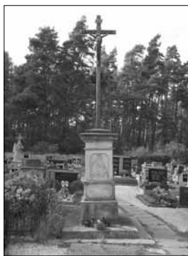
Kříž na hřbitově. Foto: autor, 2015