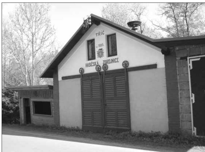
Tříčská hasičská zbrojnice a zastávka autobusu uvnitř vyzdobená dochovaným nápisem „SE SVOBODOU A DUBČEKEM za svobodu“ z roku 1968

roku 1960 Hradsko a Blansko s továrnami byly připojeny k Jablonci. Ústav chirurgie ruky byl otevřen ve Vysokém 1975 v budově bývalé okresní všeobecné nemocnice. Kulturní dědictví po předcích v některých oblastech dosud žije. Je to především divadlo. Malovaný nábytek, podkrkonošské kroje, malované i „chodící“ betlémy, pracovní a domácí nářadí velmi funkční, ale i esteticky zajímavé, jsou uchovány v muzeu, které dokumentuje v písemných záznamech a fotografiích i další projevy kultury na Vysocku. Sbor Církve československé husitské má pamětní síň zakladatele a prvního patriarchy církve Karla Farského, který se narodil 26. 7. 1880. Národní přehlídky venkovských divadelních souborů, pořádané každý podzim ve Vysokém od roku 1971, se staly trvalou součástí kulturního života města i širokého okolí. Místní ochotníci, jako pozorní hostitelé, i vděčné občanstvo, vytvářejí jejich neopakovatelnou atmosféru. Představení po celý týden bývají vyprodána. Během dne probíhají hodnotící semináře a kurzy divadelní praxe. Denně vychází přehlídkový zpravodaj „Větrník“. Dvacátý ročník přehlídky roku 1989 přijal nový název „Krkonošův divadelní podzim“. Klub českých turistů ve Vysokém od roku 1977 pořádá pochod krajem Zapadlých vlastenců. V zimě pořádá lyžařskou akci „Ve stopě první středoevropské padesátky“.