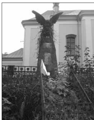
Pomník padlým za první světové války.