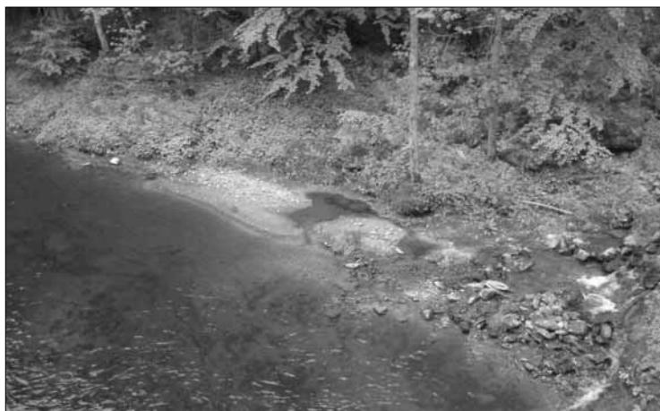
Vysocký potok vtékající do Jizery pod vysockým zříceným hradem Nístějkou.

Poloha v nadmořské výšce 695 m dala Vysokému jméno. Město leží na náhorní planině, kdežto k němu připojené obce – Sklenařice, Tříč, Stará Ves a Helkovice – se rozběhly po stráních údolí potoků, z nichž tříčský a sklenařický stékají do Jizery, staroveský do Vošmendy a s ní do Kamenice. Neobydlené zůstává údolí potoka vysockého, který se vlévá do Jizery pod zříceninou hradu Nístějky, a na západě údolí potoka Vošmendy. Vzdálenost od center