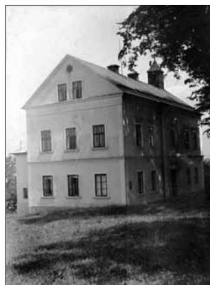
Škola, pravděpodobně 30. léta.