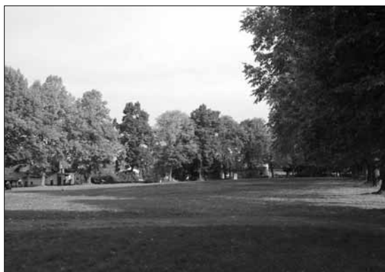
Místo konání „hlavických poutí“.