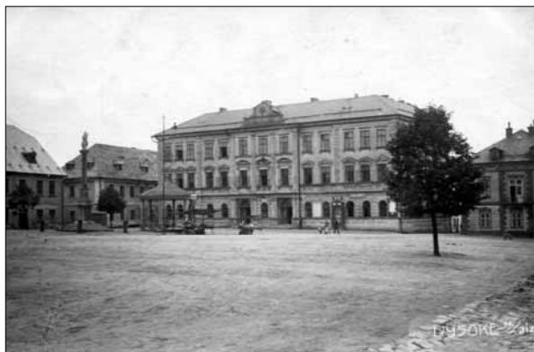
Vysoká škola a radnice před rokem 1922.

votní personál. 1923 zavedena pravidelná autobusová doprava Semily – Vysoké – Jablonec nad Jizerou. 1925 vybudována plovárna, postaveno divadlo a sbor Církve československé. Roku 1928 v rámci reformy veřejné správy byl zrušen vysocký samosprávný okres. Jinak byl tento rok pro Vysoké velmi příznivý: 1928–1929 postavena budova hospodářské školy, která zde byla založena roku 1921, v tomtéž dvouletí postavena i nová budova okresní hospodářské záložny, 1928–1930 Kramářova vila; 1928 proti parku zřízeno tenisové hřiště. Rekreace letní i zimní měla ve Vysokém vhodné podmínky, zejména přírodní. Ubytování sloužila chata Skiklubu, hotel Mařatka a hotel Bartoníček, postavený 1934. Stravování mimo to poskytovaly ještě dva hostince. Možnosti ubytování v soukromí byly omezené, proto roku 1937 postavilo město s podporou Občanské záložny „Vysockou boudu“ o deseti pokojích. Významné osobnosti českého kulturního života lákala do Vysokého krása horské přírody i kulturní atmosféra. Takovými hosty byli básníci Viktor Dyk, Antonín Sova, Otakar Theer, Karel Konrád, Konstantin Biebl; spisovatelé Karel Václav Rais, Antal Stašek, rodák z nedalekého Stanového, Helena Malířová, po otci z vysockého rodu, místní rodák Zdeněk Rón; hudebníci Karel Kovařovic, Bohu-