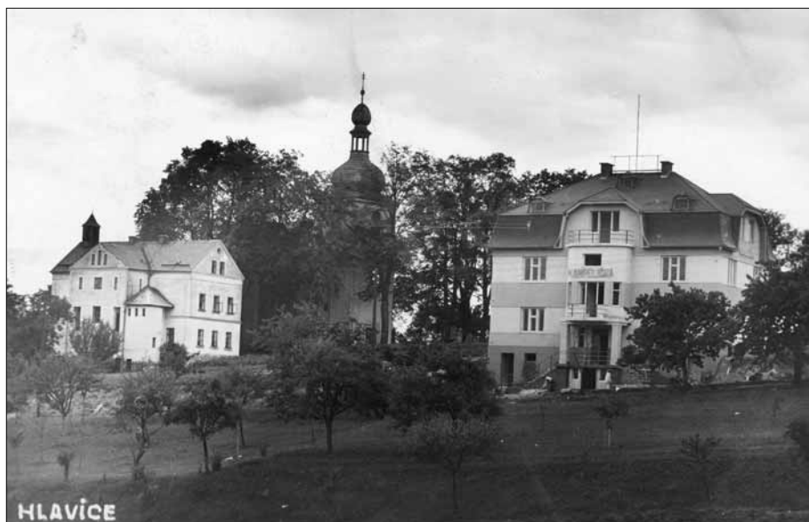
Kampelička, škola a kostel sv. Linharta, pravděpodobně 30. léta.

Osada Hlavice je přirozeným středem této krajiny, proto v dobách nedávno minulých soustřeďovalo se zde životní dění krajiny: poutě, fara (církvní úkony), Kampelička, školy, kino, spolkový a společenský život. Obec rozkládá se po obou stránkách, tvořících hluboké údolí. Nejvyšší bod je u kostela (406 m n. m.), nejnižší 342 m n. m., kde opouští potok Malá Mohelka katastr hlavický. Poštovní úřad a stanice SNB je v sousedních Všelibicích, 3,2 km vzdálených, ač přirozenější jejich střed by byl pro krajinu v Hlavici.“