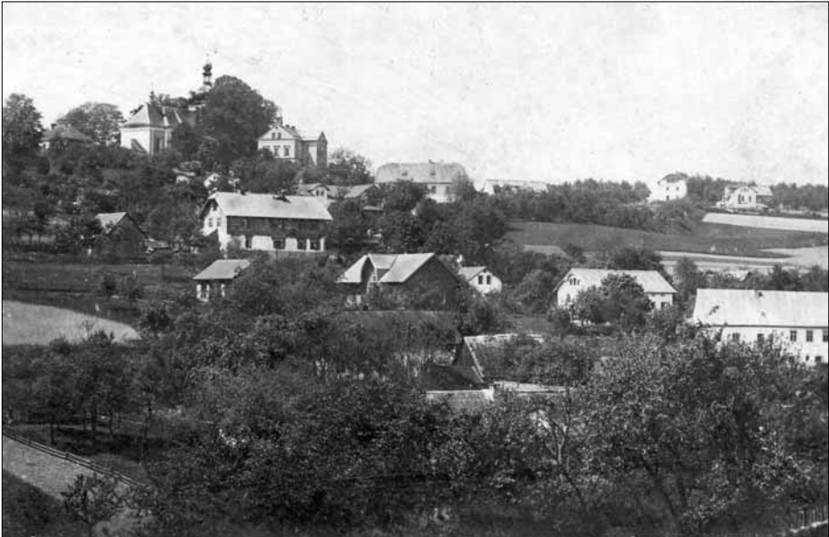
Pohled na Hlavici s kostelem sv. Linharta, pravděpodobně 30. léta.

Hlavice se může pochlubit bohatým občanským zázemím, krásnou příro- dou, množstvím kulturních a přírodních zajímavostí. Z obce se nabízejí daleké výhledy jak na Ještědský hřbet, tak i do Českého ráje nebo na Bezděz.