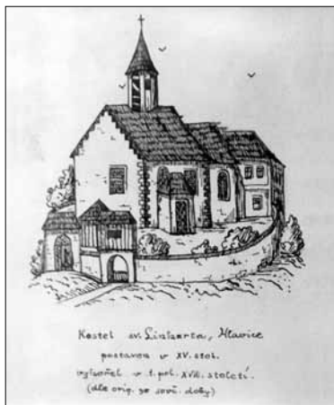
Dobové vyobrazení kostela sv. Linharta.