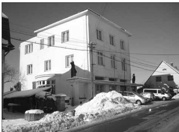
Vysocké čp. 308 vystavěné pro hospodářskou záložnu a sloužící nyní jako jedna z budov integrované střední školy.

Karel Kramář na mírové konferenci v Paříži přesvědčoval vítězné mocnosti, že je třeba osvobodit Rusko, obnovit v něm pořádek a civilizaci, aby byla zajištěna světová rovnováha a tím mír. Dějiny mu daly za pravdu. Veřejný život