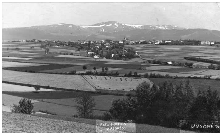
Pohled na město Vysoké nad Jizerou od Tříčce mezi lety 1926 a 1929.