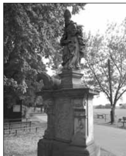
Socha sv. Linharta. Foto: autor, 2015

Dva zvony byly znovu pořízeny v roce 1935. Za druhé světové války proběhla další rekvizice. Dnes visí ve věži pouze původní zvon z roku 1568. Roku 1909 se uskutečnila větší oprava varhan. Roku 1916 sňali lucernu a bání z důvodu špatného stavu bání a zvonici provizorně přikryli dřevěným přístřeškem. To zůstalo do roku 1925, kdy byla bání a lucerna opravena.