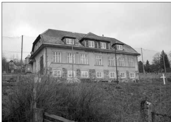
Bývalá Masarykova jubilejní škola ve Sklenařicích.