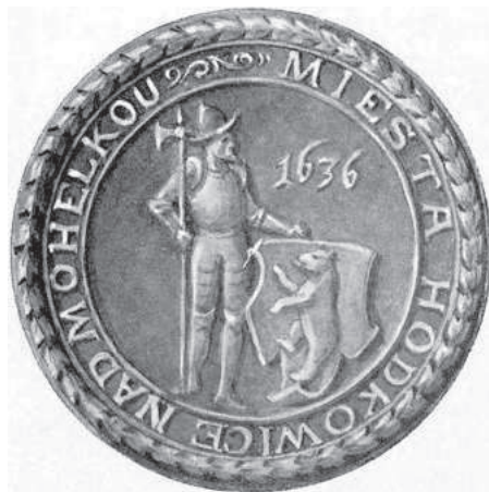
Jediným možným přiblížením doby udělení znaku je existence a otisky dochovaných městských pečeti. Jako příklad uvádím obrázek jedné z nich.

Vliv Dražických se promítl i do používání městských barev a praporů. Hodkovice mají ve znaku ve stříbrném poli vztyčeného černého medvěda v bojovém postavení. Barvy praporu podle heraldických pravidel by měly být černá a bílá, ale místo černé barvy je barva modrá, převzatá ze znaku pánů z Dražic.