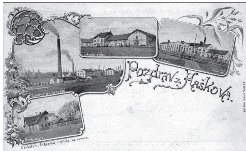
Všechny objekty v Haškově se staly součástí podniku LIAZ.

Už od 12. století vznikaly v našem kraji na Jizeře mlýny. Jeden z nich stál tam, kde se Jizera dělí na Velkou a Malou, v místech zvaných dříve Roztoky. Druhý byl kousek po proudu na Malé Jizeře. Písemná zmínka o mlýnu v Roztokách pochází z roku 1345. Patřil rodu Markvarticů ze Zvířetic. V roce 1504 je v zemských deskách zapsán mlýn v Roztokách