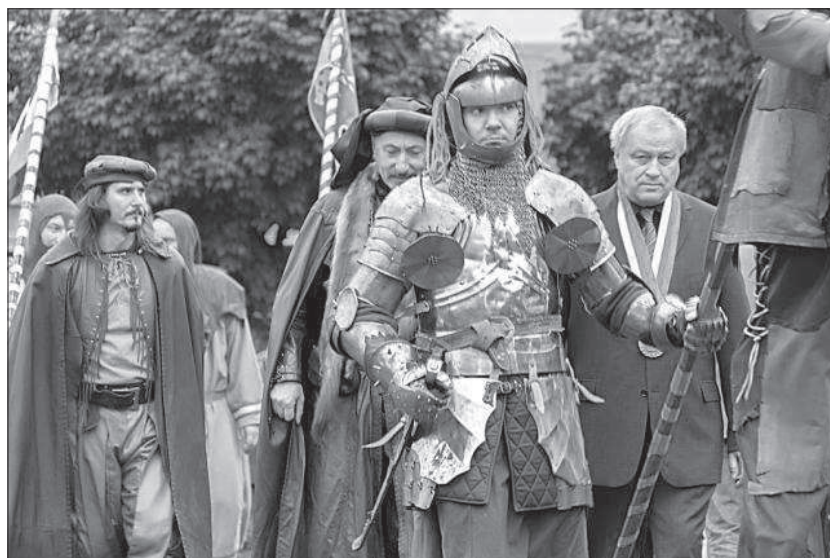
Hodkovické slavnosti 2012 – průvod městem