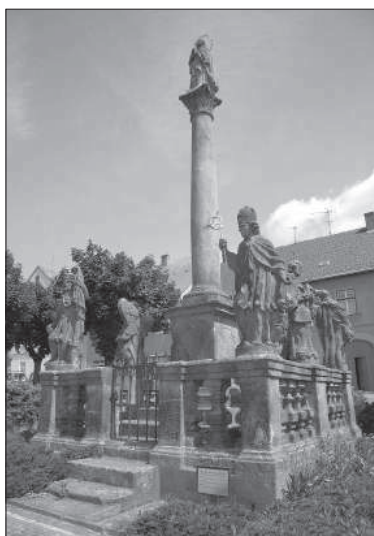
Sousoší na náměstí bylo vytvořeno v r. 1710