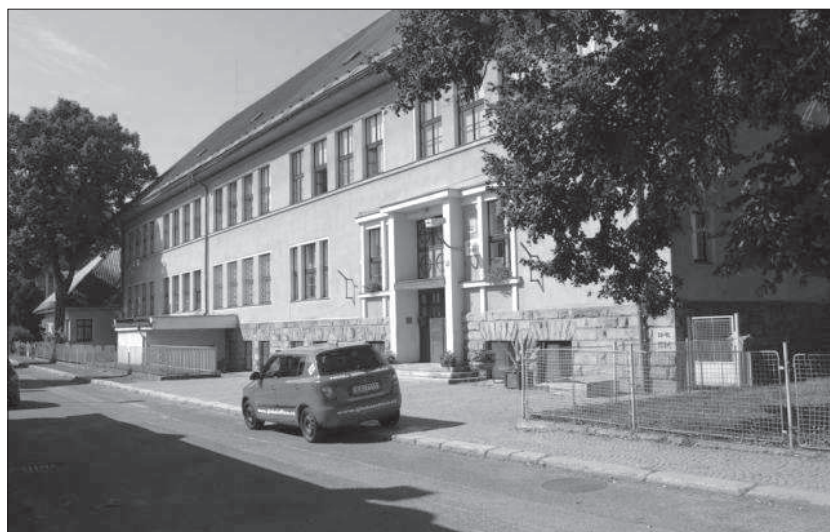
Hodkovice měly školu německou i českou. Nová česká škola byla dokončena v r. 1925