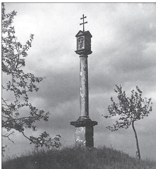
Toskánský sloup v Malení

Již 22. 12. 1918, když se začalo jednat o výstavbě ptýrovské elektrárny, byla v obci ustavena komise na zřízení elektrického osvětlení. Kolaudace elektrorozvodné sítě proběhla 13. 4. 1921. Již po skončení 2. sv. války byl podél silnice položen dálkový plynovod. V roce 2006 byl v části obce proveden nový rozvod plynu.