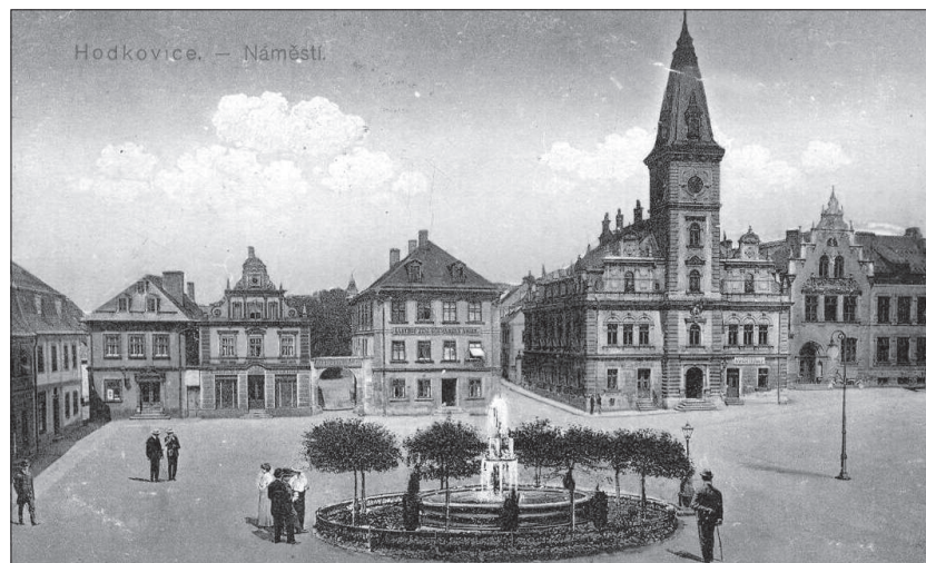
Hodkovické náměstí z r. 1914