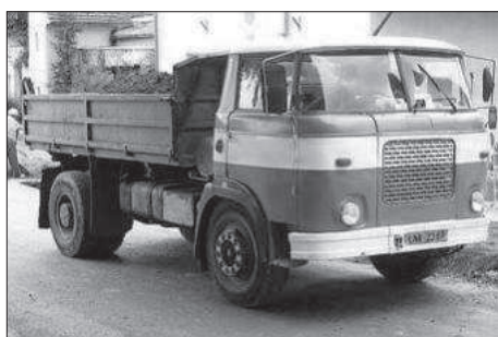
Typický výrobek podniku LIAZ

Všechny výše zmíněné závody, objekty a parcely byly základem pro výstavbu továrny LIAZ. Národní podnik LIAZ (Liberecké automobilové závody) byl založen v roce 1951, v Haškově se nacházel jeden z jeho čtyř závodů. Ještě téhož roku zde byla zavedena výroba nákladních automobilů a začalo se s budováním nové haly montážní linky. Ta byla v plném provozu od roku 1953. V roce 1969 se LIAZ rozšířil o další plochy (pole) směrem k Veselé až k potoku Veselka. V roce 1987 naplno začala výroba