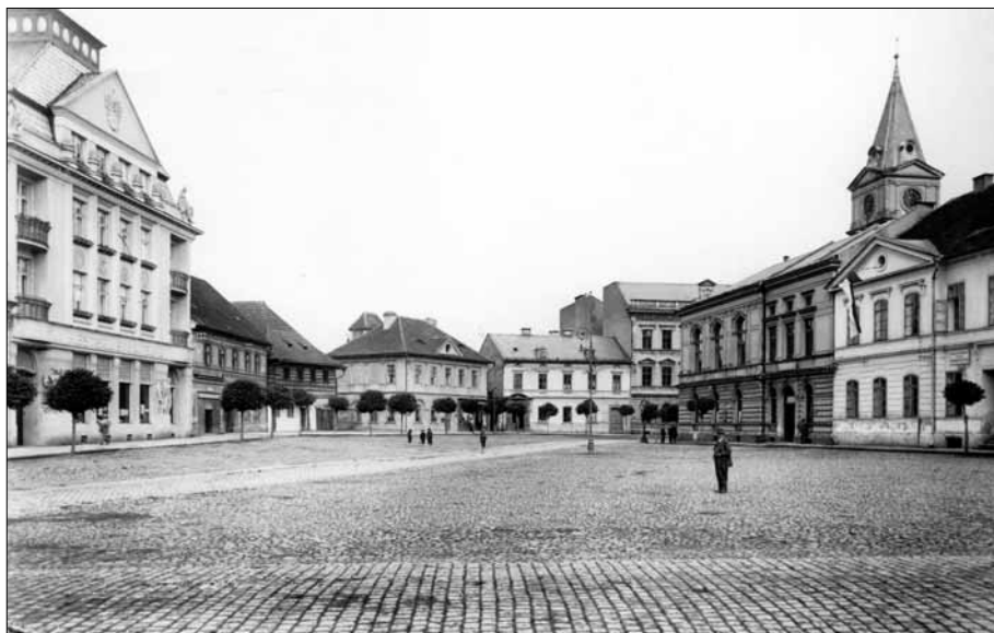
Náměstí krátce po první světové válce