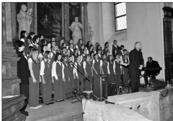
Koncert dětského pěveckého sboru Zvonky

Ve městě působí několik desítek spolků, zájmových sdružení a organizací. K těm tradičním, jejichž kořeny sahají do 19. století, patří sbor dobrovolných hasičů, ochotnický divadelní soubor Tyl, TJ Sokol (největší popularitě se těší nohejbal, volejbal a stolní tenis) a také baráčnická obec. Několik spolků cílí na děti a podporuje jejich aktivní trávení volného času (Dětský pěvecký sbor Zvonky, Junák – český skaut, Klub dětí a mládeže, Liga lesní moudrosti), jiná sdru-