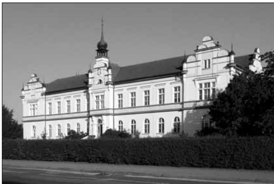
Budova okresního chorobince, dnes léčebna dlouhodobě nemocných

učiliště měly později také Severka i LIAZ. Oproti meziválečnému období přibyla v roce 1949 první mateřská škola a o několik měsíců později jesle. Protože počet dětí rychle narůstal, byla v roce 1963 otevřena nová budova mateřské školy v Mírové ulici. Ve zdravotnictví bylo na celostátní úrovni výraznou změnou zavedení povinného pojištění, díky kterému se zdravotní péče stala dostupnější všem vrstvám obyvatel, v Mnichově Hradišti pak došlo ke zřízení Okresního ústavu národního zdraví. Okresní chorobinec stal roku 1945 dočasně sídlem Okresního národního výboru a poté, co se Mnichovo Hradiště stalo součástí okresu Mladá Boleslav a místní ONV bylo zrušeno, se secesní budova stala nemocnicí pro plicní choroby. Změnu přinesla také další modernizace: v letech 1946–1952 byla zavedena kanalizace, v roce 1952 bylo otevřeno kino a na severním okraji města vzniklo na konci padesátých let přírodní divadlo (letní kino).