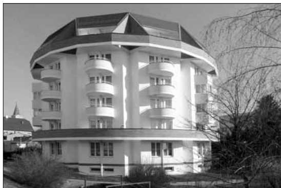
Dům s pečovatelskou službou

Po sametové revoluci se nejen uvolnila politická atmosféra, ale zmizely také symboly režimu. V průběhu celých devadesátých let docházelo k nejrůznějším změnám. K těm pozitivním patřila jistě výstavba domu s pečovatelskou službou, instalace nových zvonů, výstavba domova důchodců za budovou léčebny dlouhodobě nemocných, postupně byly opraveny budovy v zámeckém areálu. LIAZ i Severka v průběhu devadesátých let zanikly, a ačkoli se z dosavadní