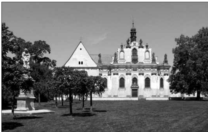
Kostel sv. Tří králů s kaplí a sochou sv. Anny

jektu se nachází městské muzeum, v němž návštěvníky zaujme zejména model Drábských světniček. Jak již bylo zmíněno výše, kaple sv. Anny, v níž je dnes umístěn originál stejnojmenné pískovcové sochy, je místem posledního odpočinku generalissima Albrechta z Valdštejna.