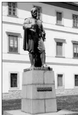
Socha Václava Budovce z Budova u zámku