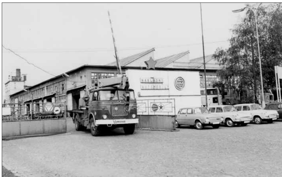
Ve 20. století bylo město neodmyslitelně spjato s LIAZem

Život stovek obyvatel Mnichova Hradiště ovlivnilo na počátku padesátých let zřízení pobočky podniku Avia Letňany. Automobilka se roku 1953 stala pobočkou Libereckých automobilových závodů. Areál národního podniku vznikl na místech někdejší osady Haškov a propojil tak Veselou s Mnichovým Hra-