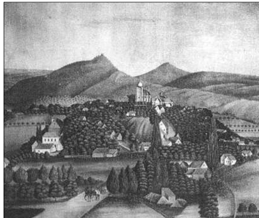
Dobové vyobrazení Železnice z roku 1848. J. Rameš.

Už pojmenování místa, kde stávala dle pramenů tvrz pánů z Iseburka, má bezpochyby souvislost se železem.