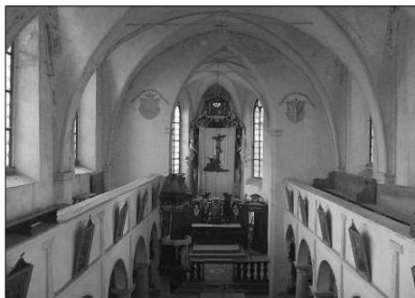
Pohled na interiér kostela Narození Panny Marie z kůru.