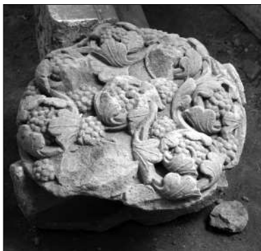
Klášter Hradiště – charakteristický stavebně-ozdobný detail z klenby opatského chrámu (13. stol.)

1145 cisterciáky z Plas. Klášter v Hradišti nad Jizerou byl tak jedním z prvních cisterciáckých klášterů v Čechách. Velký rozmach kláštera nastává o století později. Asi v polovině 13. století v hradištském klášteře vznikají mohutné raně gotické stavby, zejména opatský chrám, který byl postaven napříč