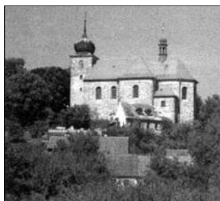
Kostel sv. Jiljí.

V současnosti představuje Železnice správní území zahrnující vlastní město a dále přidružené obce: Cidlinu, Těšín, Zámezí, Březku, Doubravici, Pekloves. Počet obyvatel představuje 1230 jedinců. Nadmořská výška Železnice se udává 320 m n.m. Město je členem několika sdružení. Členství v nich Železnici umožňuje snadnější přístup k různým dotačním programům a současně slouží i k výrazné propagaci města a okolí. Zmíněnými sdruženími jsou: Svaz měst a obcí ČR,