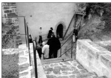
Vstup do otevřené kostelní krypty.

Tato stavba byla započata již ve 12. století a nese proto ještě stopy románského slohu, jak vidíme z dochovaných románských oken s opěrnou zdí. Vnitřek sklepení se skládá z 12 klenbových polí ve dvou řadách, v každé po šesti. Jsou podepřeny 5 pilíři uprostřed. Délka sklepení je 28, 6 metrů a šířka téměř 8 metrů. Klenba je románská, z plochého lomového kamene (stavěného úzkou hranou ven, zalitého tvrdou maltou) a je podepřena gotickými oblouky z hladce tesaných kvádrů, oblouky pak vyrůstají z podobných pilastrů, přistavených v síle 10 cm k celé šířce pilířových stran. Zdivo těchto podpor není vázáno s původním zdivem, nýbrž bylo připojeno později. Kamenické značky na kvádrech připor datovaly toto dílo jako současné se vznikem hlavního portálu. Románská okénka mají zevnitř výšku 218 cm a šířku 110 cm.