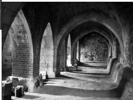
Část dvanáctiklenbové krypty opatského chrámu. (Ještě 12. století.)

skalnatým ostrohem. Poně- vadž prostor, jež byl vybrán pro stavbu chrámu, byl ne- rovný, byla východní část snížena. Protože však pouhý násep by nezajišťoval dosta-