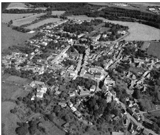
Letecký snímek nejlépe prozradí urbanistické řešení města.

Dnešní kostel sv. Jiljí stojí na místě původního románského kostela sv. Jana Křtitele, který byl zničen během třicetileté války. V letech 1727 – 1739 byl kostel přestavěn