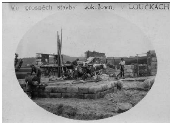
Stavba sokolovny (1923 –1925)

„Dne 13. prosince 1925 byla otevřena v Loučkách Sokolovna. Vystavěna byla členstvem za těžkých podmínek. Rozpočet byl 224 tisíc korun. Jednota měla na počátku pouze 3 tisíce. Práce zdarma, oběti a dary činily 140 tisíc. Zbývá 70 tisíc dluh a 11 tisíc berní roční půjčky členstva. Rokem 1926 počíná se na zdejší škole vyučovati tělesné výchově pravidelně dle rozvrhu.“