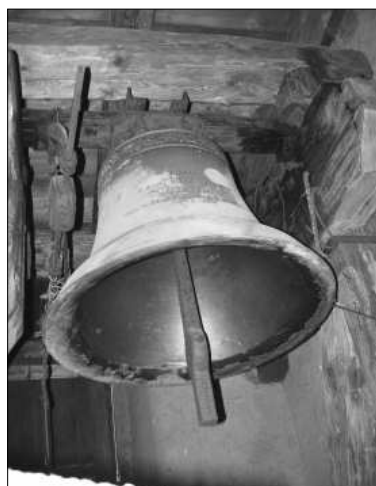
Zvon sv. Antonína