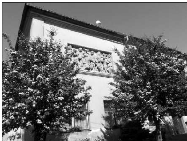
Budova bývalé školy, dnes sídlo obecního úřadu, místní knihovny a Výstavního zastavení