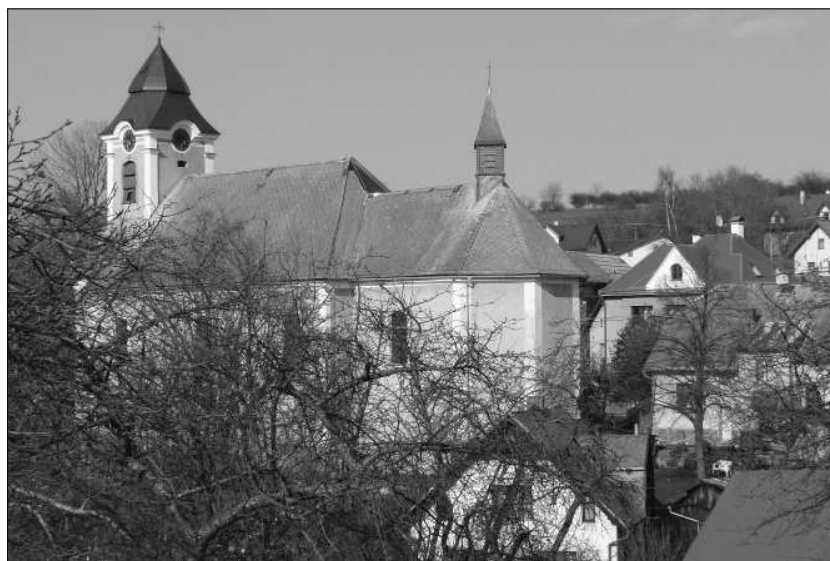
Pohled na střed obce

jarmarku“, který se koná na místo pouti kolem červnového svátku sv. Antonína - nechybí dobré řemeslo, muzika, divadlo, pohádky ani dobré jídlo a pivo. O jarmarku je zpřístupněn i kostel s věží. V dohledné době by měl být ve spolupráci se Správou CHKO ČR vyřešen i problém, který zaměstnává zastupitelstvo obce od doby první republiky – úprava cesty do Podlouček, kterou „vezme“ každý větší přívalový déšť. Myšlenka na možnost vytvořit zde navíc další „naučnou stezku“ je v souladu se záměry připravovaného plánu rozvoje obce a jejího územního plánu. Možná dojde i na splnění velkého snu starosty – postavit v obci a nabídnout přicházejícím turistům rozhlednu. Zkrátka – zveme vás do Louček, stojí zato se přijet podívat!