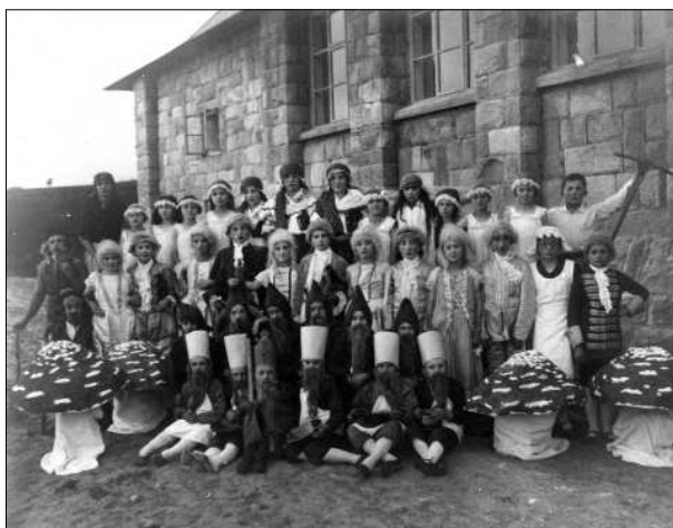
Ze sokolského divadelního představení