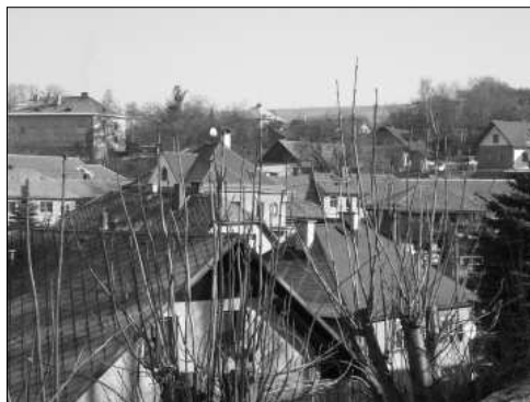
Střed obce Loučky

I když obec leží v blízkosti velmi exponovaných lokalit pravěkého osídlení (v sousedství okolních skalních měst), o její nejstarší historii nemáme žádné doklady. Na katastru obce prozatím neproběhl ani žádný archeologický výzkum. Shovívavý úsměv vyvolává pověst o původu názvu obce – „může“ za něj hluchý stařeček, který štípající na návsi borové louče, odpověděl na otázku po jménu obce, co dělá