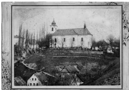
Kostel sv. Antonína kolem r. 1890