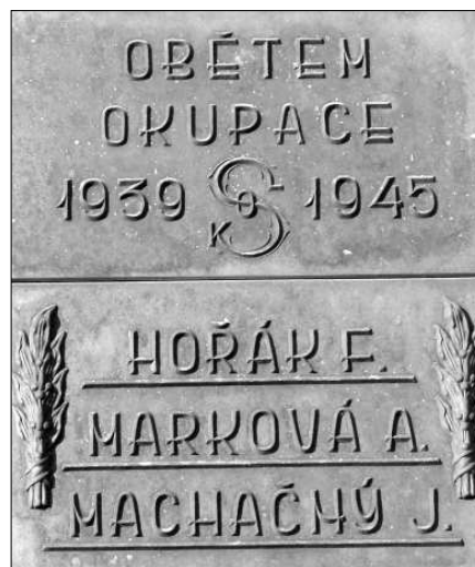
Pamětní deska obětem fašismu