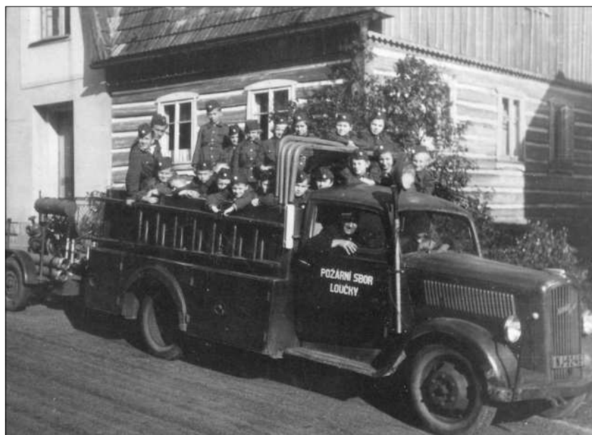
Sbor dobrovolných hasičů (50. – 60. léta 20. století)