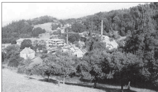
Velká výstavba nových hal „Preciosy“ v r. 1985. To se ještě uvažovalo o dalším rozkvětu sklářské výroby i na Frýdštejně.

Čtyři válečná léta uvolnila prostor pro japonskou konkurenci. Ta během šesti let zvýšila výrobu a vývoz kroužků jedenáctkrát. Jablonecká produkce po válce obtížně konkurovala jejím nízkým cenám. Na indickém trhu se prosadily jen bengle lepší kvality a nápaditého dekoru, jako emailové zdobené, lampové hladké, broušené i malované a také bengle zrcátkové. Hospodářská krize na počátku třicátých let výrobu benglí ochromila. Japonská konkurence zaplavila omezený indický trh levnými kroužky, takže se jejich výroba a nákladná doprava do vzdálené země přestala výrobcům na severu Čech zcela vyplácet.