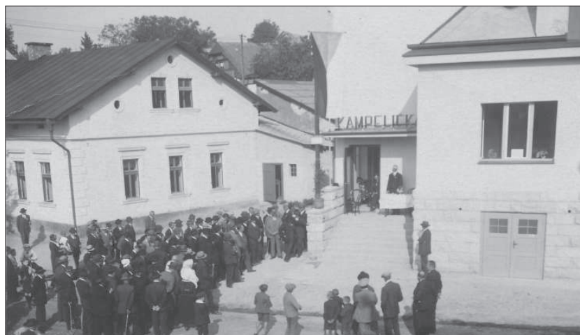
Slavnostní otevření kampeličky dne 30. září 1934.

škole a úřadovala v neděli. Kampelička přijímala vklady a poskytovala půjčky za lepších podmínek než ostatní peněžní ústavy. Postupně rozvíjela také obchodní služby. Prodávala uhlí, hnojiva a další potřeby zemědělcům a občanům venkova. Stala se významným hospodářským činitelem v obci i okolí (vlastně celostátně). Stoupající rozsah činnosti a dobré výsledky ústavu umožnily, aby nákladem 110 tisíc postavila v Markvarticích kancelářskou a provozní budovu. K slavnostnímu otevření za široké účasti veřejnosti došlo 30. září 1934.