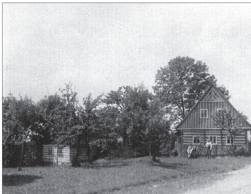
Charakteristické rázovité stavby svých venkovských roubených obydlí začali budovat – (dřeva a potřebných pískovcových či pískovcově-čedičových kamenů bylo v okolí dost) – převážně v 17. – 19. století – také obyvatelé frýdštejského podhradí...