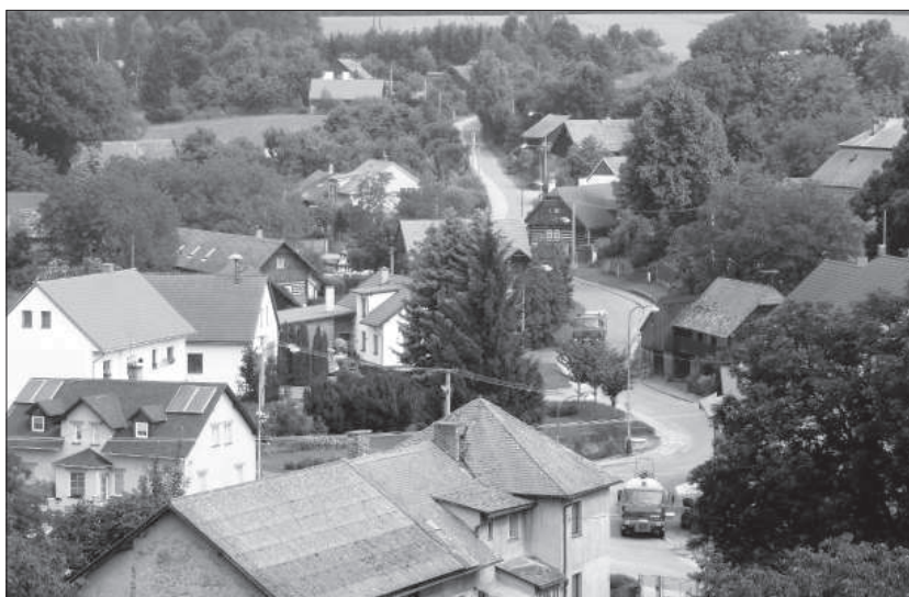
Panorama obce, severní část.

Další modernizace vybavení sboru se uskutečnily v letech