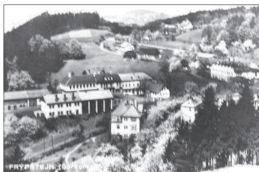
Tovární sklářská výroba pomáhala obci se rozrůstat a modernizovat. Pohled asi z 30. let na už výrazně průmyslový Frýdštejn (Barborka).

V roce 1906 nestačila frýdštejská brusírna plnit objednávky. Antonín Schmidt koupil v Turnově bývalou koželuznu a i v ní zavedl stejnou výrobu. Pod vedením syna Ludvíka tady pracovalo dvacet dělníků, za dalších pět let se jejich počet ztrojnásobil. Kromě odpukávání, srážení, broušení a leštění se v turnovské brusírně kroužky také malovaly.