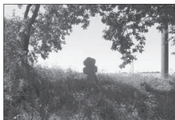
Smírčí kříž u starého markvartického hřbitova (údajně až z doby cyrilometodějské).