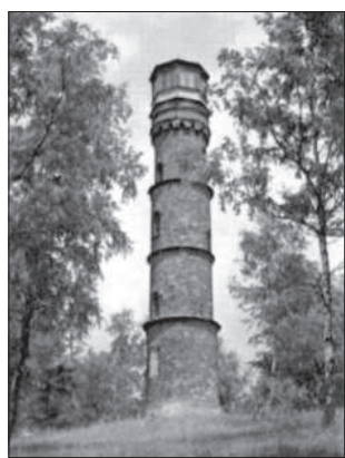
Kopanina – rozhledna.

Sám Frýdštejn není jen turisticky nejatraktivnější zříceninou hradu. V katastru obce je řada dalších míst, která stojí za povšimnutí. Na