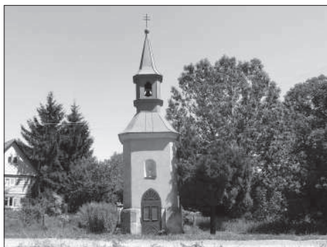
Zvonička v Mrkvojedech.

Markvartice byly vždy kulturním, společenským, správním i hospodářským centrem vesnic širokého okolí. První dřevěný kostelík, zasvěcený sv. Jiljí, sloužil v obci od roku 1334. Doložena je činnost faráře Oldřicha v roce 1355. Za faráře Jiruse Hoříckého v roce 1569 byl pořízen první velký kostelní zvon. Na počátku 18. století byl postaven kostel nový, zasvěcený rovněž sv. Jiljí. Stavba je charakteristická svou cibulovitou věží a je zdaleka viditelnou dominantou krajiny.