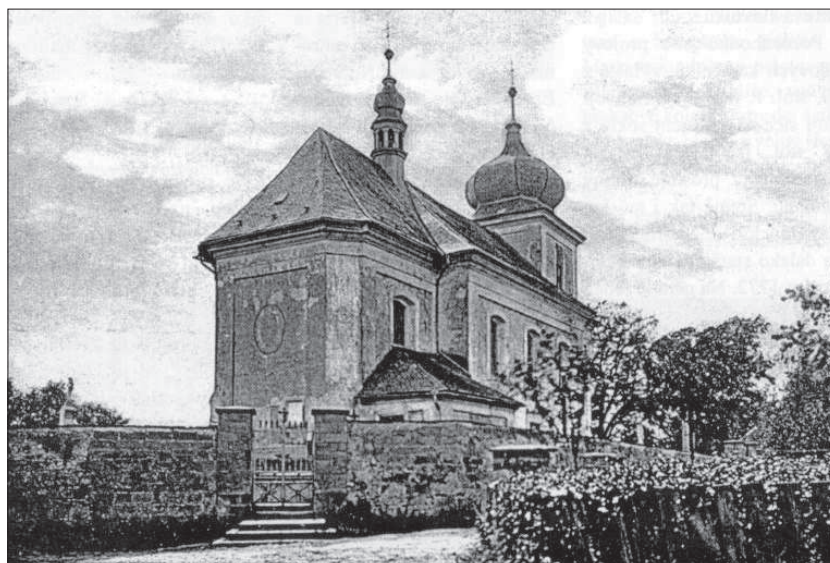
Kostel sv. Jiljí v časově vzdálenějším vyobrazení.