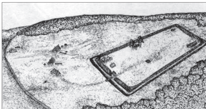
Snímek „Valů v Šancích“