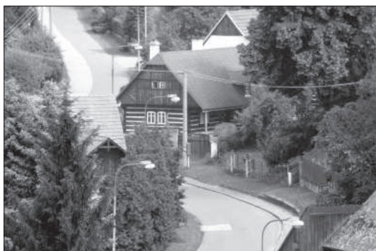
Historická chalupa čp. 46, část obce zvaná Kouta.