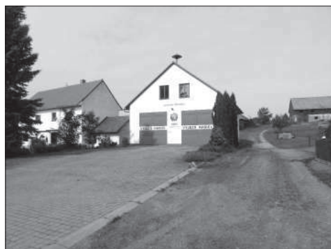
Hasičská zbrojnice v Markvarticích.

ven až na počátku roku 1919 a téměř půl století přispíval k tělovýchovnému rozvoji – zejména mládeže především vynikající výchovnou strategií vůdců Masarykovy republiky. Místní sokolská organizace byla početně silná, měla až 80 aktivních členů. Cvičili muži, ženy i mládežnická družstva. Tělocvična byla v hostinci U Tůmů, obec poskytla pozemek na letní hřiště a přispěla podstat-