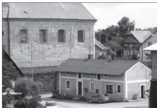
Historická část obce zvaná „Za kostelem“.

Protipožární ochranou se v obci zabývali již mnohem dříve. Podle záznamů v obecní kronice pořídila obec v roce 1826 hasičské háky, džbery a žebříky k účinnějším zásahům při požárech. O rok později, kdy rychtářem obce byl