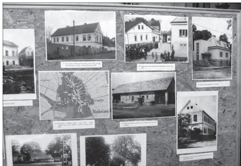
Současná výstava fotografií Josefa Jirků o jeho obci předvedená v kostele u příležitosti i zde každoročně slavené velkolepé akce „ČESKÁ KVĚTNICE“.

Poslední plošná výsadba se uskutečnila v roce 1929. Tehdy se odstraňovaly následky předchozích nebývalých mrazů. V současnosti jsou silniční stromořadí jen dožívajícím torzem. Krajinu neobohacují, spíše hyzdí. Vedou se diskuze, píše vědecká pojednání o tom, co dál, jak obnovit zašlé, ale potřebné a pěkné. Slova a námětů je mnoho, nová tako-