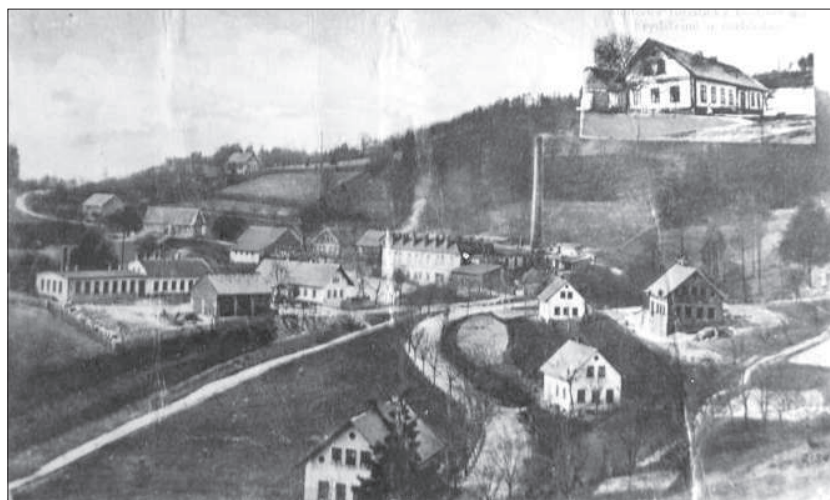
Pohled na Frýdštejn – obec na konci 19. stol., když se Frýdštejnští doslova vrhli na podnikání a sklářskou výrobu.

v turnovském okrese, a pořídil mačkáací stroje. Nejdříve mačkal sám, pak přibral dělníky „na zaučenou“. Roku 1885 postavil novou, patnáct metrů dlouhou mačkárnu. Zvětšil obytný dům, za další dva roky přistavěl zámečnickou dílnu, záhy nato objednal ve Vídni parní stroj a v patře svého domu zřídil brusírnu s mechanickým pohonem. Koncem osmdesátých let lidé ze širokého okolí chodili „ke Schmidtům“ obdivovat jedno z prvních elektrických osvětlení. V krizovém roce 1890 se rozhodl k riskantnímu kroku: pustil se do stavby velké moderní brusírny, pro niž pořídil nový parní stroj, parní vytápění a elektrické osvětlení. Od následného roku v ní opracovával černé sklo i skleněné kameny.