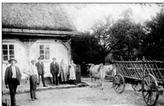
Rodina Libenských u chalupy čp. 22, v níž se provozovalo bednářství

31. října 1918 se konala na návsi oslava vzniku Československé republiky spojená se zničením všeho, co připomínalo zaniklou monarchii. Na počest této velké události byla v dubnu následujícího roku vysazena „lípa svobody“, která náves zdobila až do roku 2013, kdy musela být z bezpečnostních důvodů pokácena. Velké nadšení ze vzniku samostatného státu bylo spojeno s vytvořením hospodářské rady, která dohlížela na zásobování obyvatel, dále s opravami místních komunikací nebo s elektrifikací obce a se stavbou skupinové vodovodní sítě, ale i s košatou spolkovou činností. Vedení obce vypomáhaly poradní orgány jako osvětová komise, místní školní rada, v roce 1923 bylo ustaveno Svépomocné strojní druž-