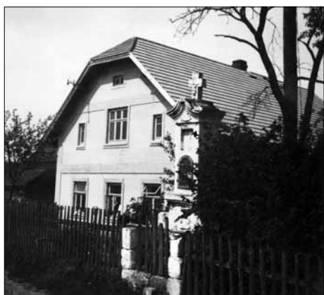
Historický obrázek z meziválečného období zachycuje Boží muka na Jirsku