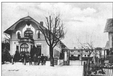
Secesní detaily Nezdarova statku čp. 17, zhotovené v roce 1916 patří k architektonickým perlám obce

Od roku 1939 fungovala v Sezemicích organizace Národního souručenství jako náhrada dřívějších politických stran. Hlavně zpočátku prostřednictvím pořádání kulturních a společenských akcí podporovala vlastenectví, její členové organizovali výlety, exkurze, sportovní turnaje apod. Ve