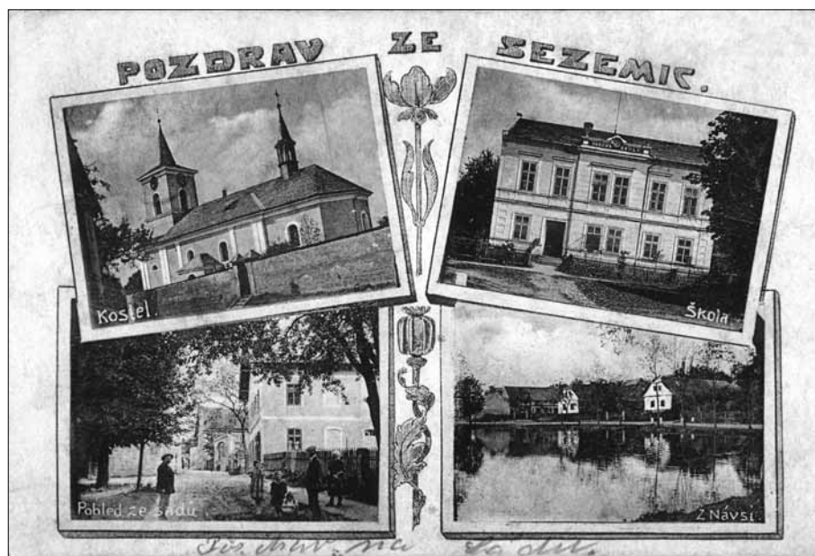
Pohlednice z roku 1916

uspořádala obec dokonce místní spartakiádu, které se zúčastnili obyvatelé okolních vesnic.