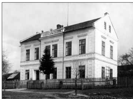
Škola v roce 1927

O škole v Sezemicích a jejím fungování se dodnes dochovalo množství informací díky školní kronice, kterou pečlivě vedli mezi lety 1877 a 1939 místní učitelé. Nejstarší zpráva o výuce v Sezemicích pochází z roku 1791. Předtím navštěvovaly děti školu v Loukově. V Sezemicích šlo až do roku 1855 pouze o exposituru loukovské školy, nikoli o samostatný ústav. Do roku 1864 se vyučovalo v pronajatých prostorách jedné z místních chalup v čp. 21, poté sloužila ke stejnému účelu bývalá panská hájovna čp. 40 a následně pronajatá místnost v čp. 39. Nová školní budova byla v Sezemicích, vedle hřbitova, postavena v roce 1881. Za provozu probíhaly stavební úpravy ještě během roku 1885. Škola fungovala do roku 1951, kdy byla pro malý počet žáků uzavřena a děti musely chodit