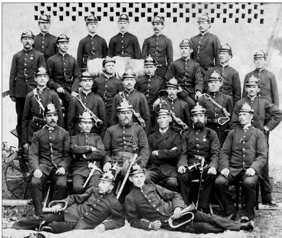
První fotografie členů sezemického sboru dobrovolných hasičů

V roce 1885 byl založen Sbor dobrovolných hasičů Sezemice . Tvořilo jej 27 zakládajících členů, kteří se věnovali nejen hašení požárů a protipožární prevenci, ale byli hlavními hybateli společenského života v obci. V roce pade-