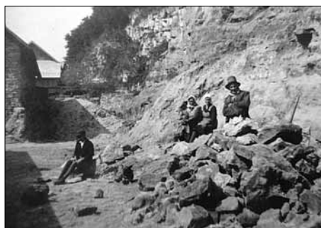
Ruční lámání kamene v Rokli za domem Holasových. Lámal se zde kámen na stavbu domů nebo na štětování cest

válečných letech se Sezemice pro svou nepříliš strategickou polohu a zároveň nevelkou rozlohu vyhnuly delšímu pobytu německých vojsk nebo zřizování okupačních orgánů v obci. Odvahu místních občanů dokládá vzpomínka na vysoce riskantní činnost, ukryvání uprchlého ruského zajatce jménem Vasil.