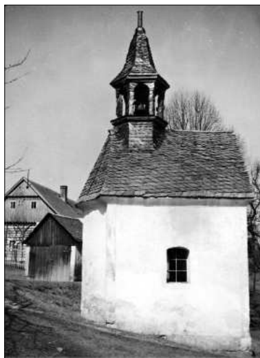
Koberovská historická zvonice byla zbourána v 50. letech.

Území má mimořádné krajinné a přírodní hodnoty, které tvoří hlavní atraktivitu cestovního ruchu. Nejvyhledávanější a tradiční je pěší turistika, cykloturistika a v zimním období běžecké a sjezdové lyžování. Po Hamštejnském hřebenu prochází Zlatá stezka Českého ráje.