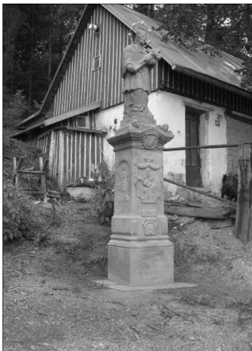
Socha sv. Jána z Nepomuku na Prosíčce byla (stejně jako její michovská souputnice) v posledních dvou letech restaurována.

V roce 1965 byla otevřena mateřská škola v budově místní Základní školy. V roce 1975 se začalo se stavbou nové budovy mateřské školy, která byla otevřena v r. 1980.