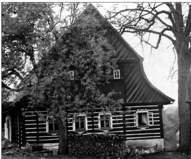
Vzácným typem roubeného objektu zdejší lidové architektury je dochovaný statek s mansardou č.p. 14 ve Vrátu.

Obec není bohatá na nemovitě památky. Přesto stojí za povšimnutí dochované roubené stavby. Obec má více jak sto staveb původní venkovské architektury. Soubory těchto staveb jsou k vidění v Besedicích,