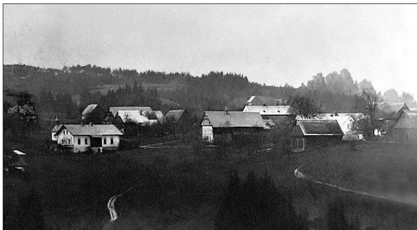
Pohled na starou (vrátskou) školu. Zachycena společně s chalupami rodů Vélových a Doubkových.