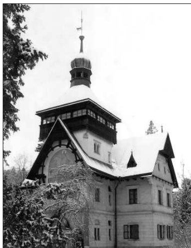
Řezníčkova vila, dnes obecní úřad.